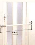
出入口用 手すり 介 住宅改修 洋式便器に