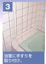
3 浴室に手すりを取り付け。