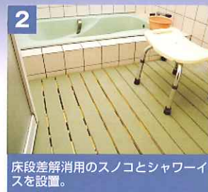
2 床段差解消用のスノコとシャワーイスを設置。