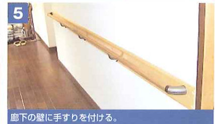
5 廊下の壁に手すりを付ける。

介護保険の適用でこれだけ改修しても 自己負担額はわずか ¥14,542 で済みました。