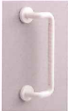
介 住宅改修 手すり