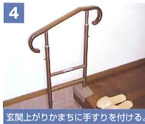
4 玄関上がりかまちに手すりを付ける。