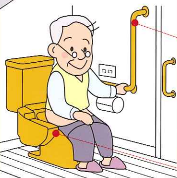
介 住宅改修 手すり