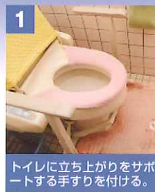
1 トイレに立ち上がりをサポートする手すりを付ける。